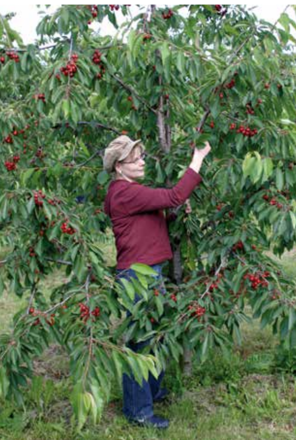
Niederstämmige Bäume vermeiden Arbeiten auf der Leiter und reduzieren damit die Unfallgefahr.

beiten. Das sollte bei der Auswahl der Familienmitglieder oder Mitarbeiter beachtet werden. Dabei ist auch das Alter zu berücksichtigen. Achten Sie auch auf regelmäßige Pausen, um Ermüdung zu vermeiden. ■